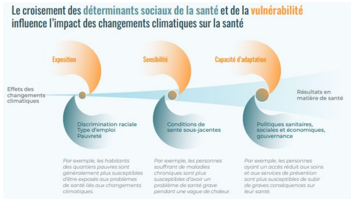
Figure 4 Le croisement des déterminants sociaux de la santé et de la vulnérabilité influence l'impact des changements climatiques sur la santé