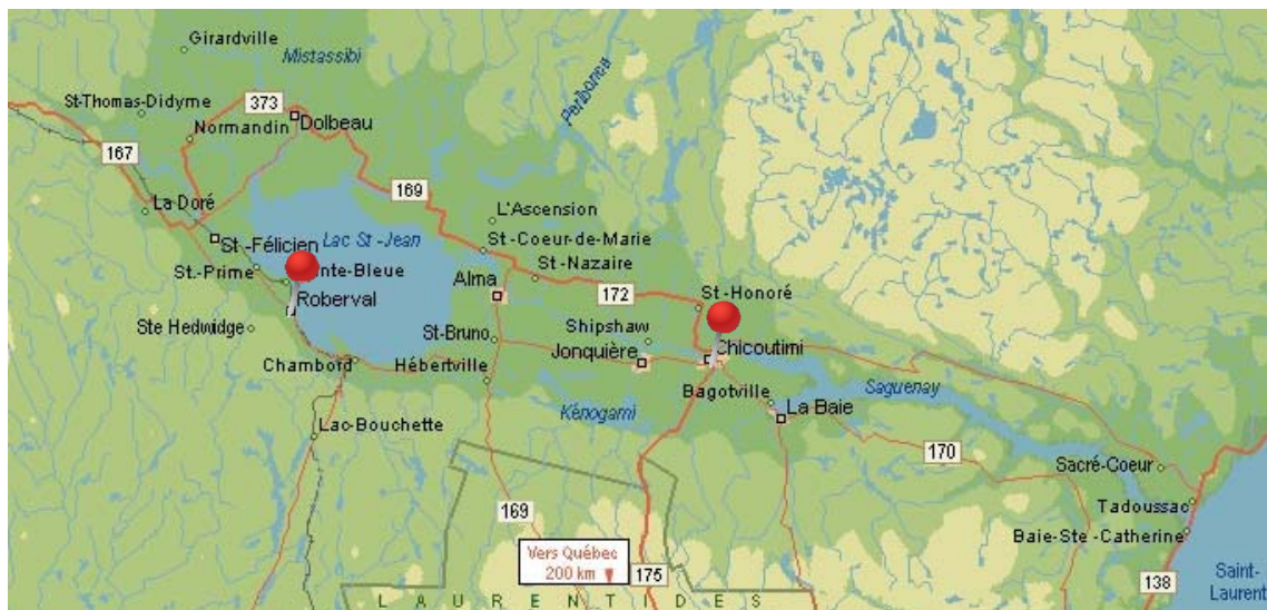
Carte du Saguenay-Lac-Saint-Jean