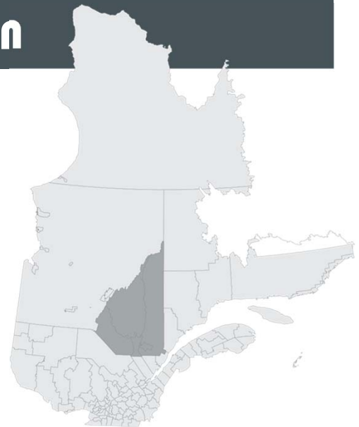
Figure 1.0 :