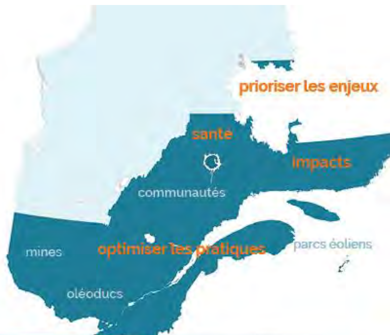
Schéma de l'évaluation environnementale au Québec méridional